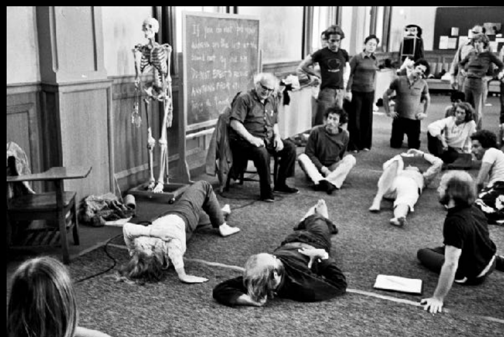
Moshe Feldenkrais répond aux questions des étudiants (formation professionnelle de San Francisco)