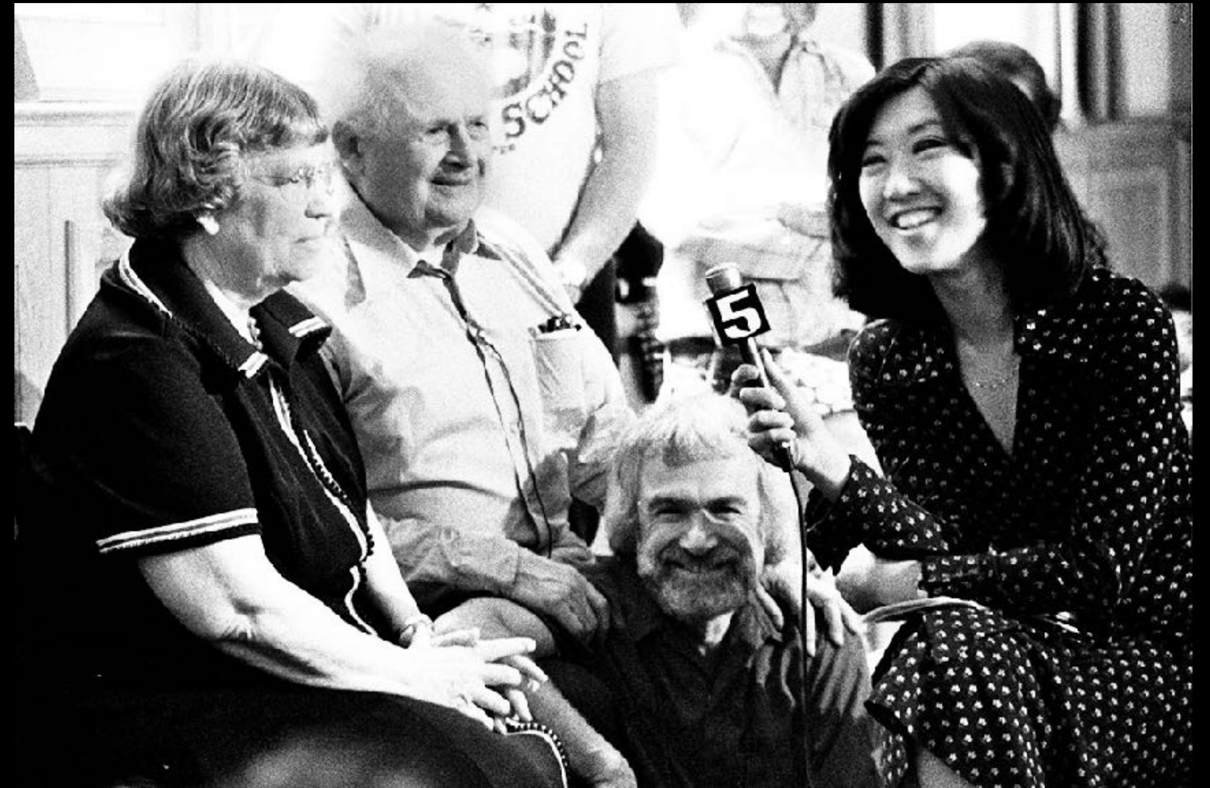
Entrevue entre Moshe Feldenkrais, Karl Pribram et Margaret Mead en visite à une formation (formation professionnelle de San Francisco)