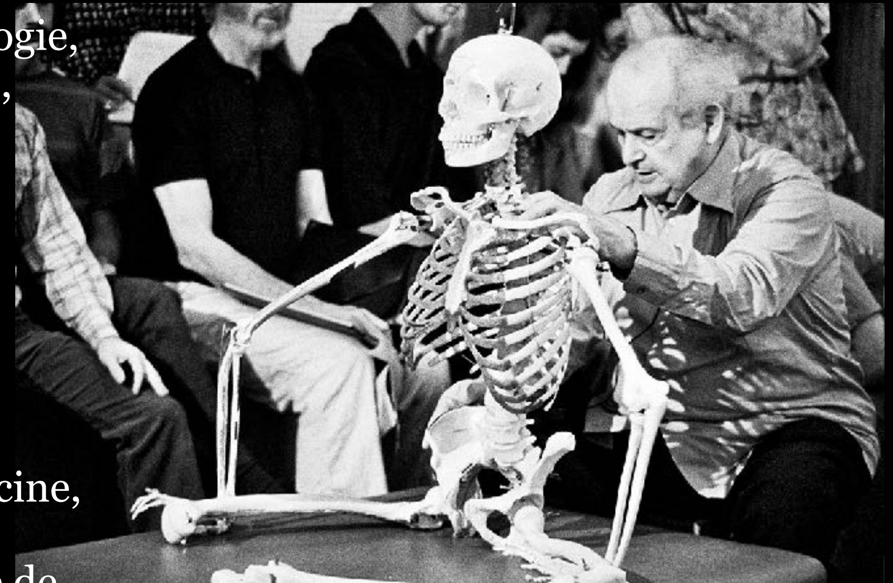
Moshe Feldenkrais explique une leçon sur une table d' Intégration Fonctionnelle MD (formation professionnelle de San Francisco)