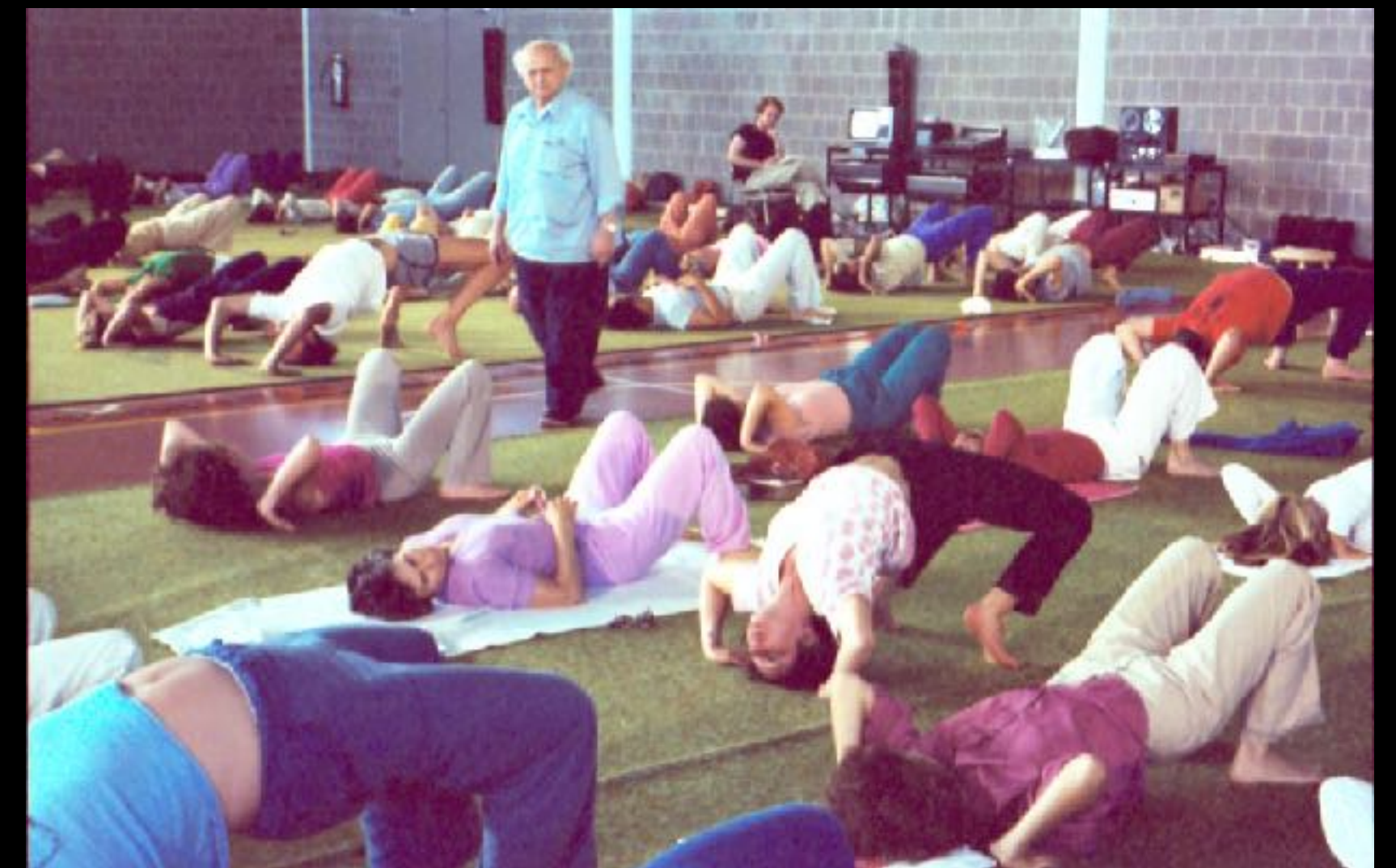
Moshe Feldenkrais donne une leçon de PCM (formation professionnelle de Amherst)