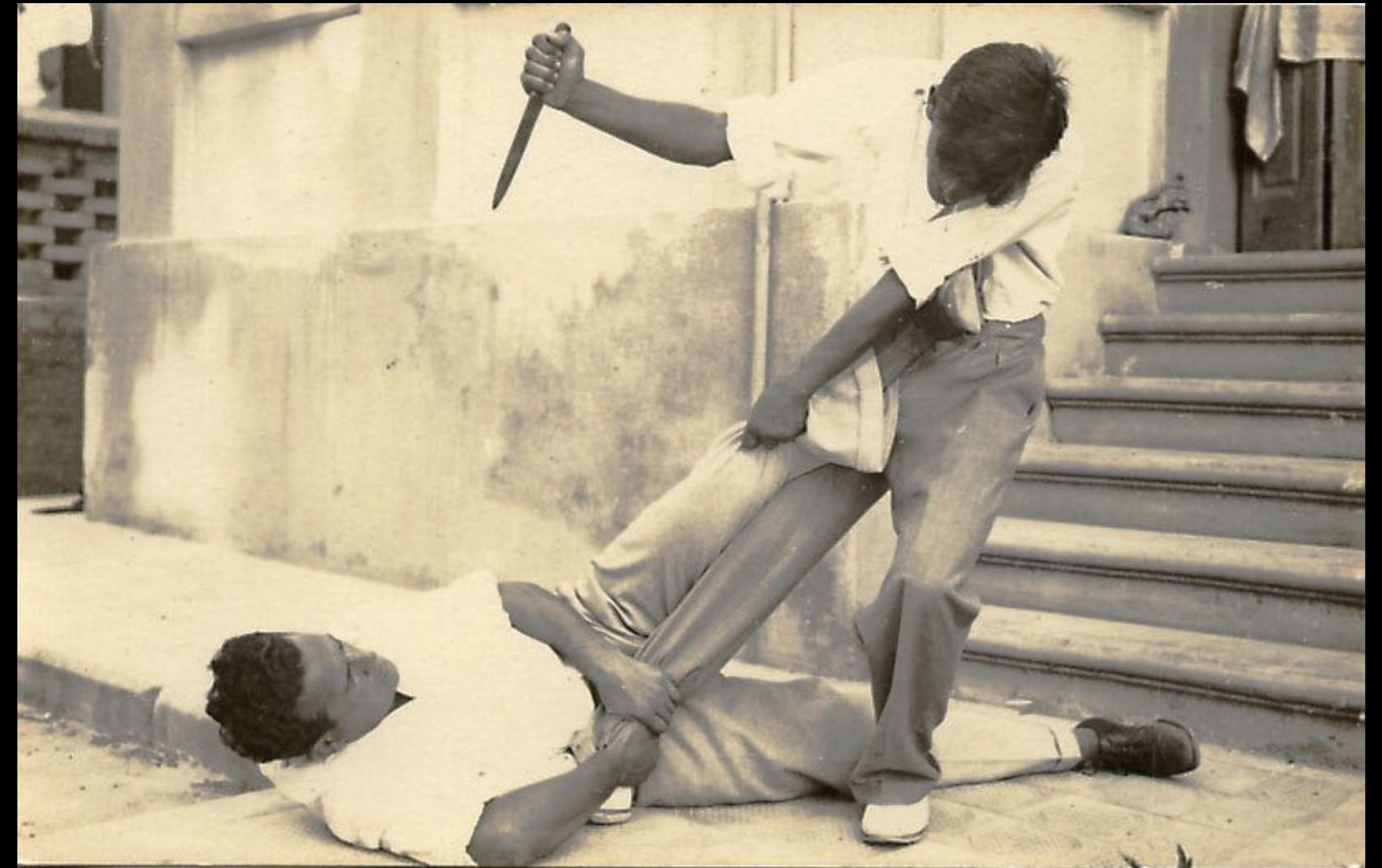
Moshe Feldenkrais en Palestine, démonstration d'autodéfense

1.4 PENSER ET AGIR DE MANIÈRE POSITIVE POUR GUÉRIR SES BLESSURES