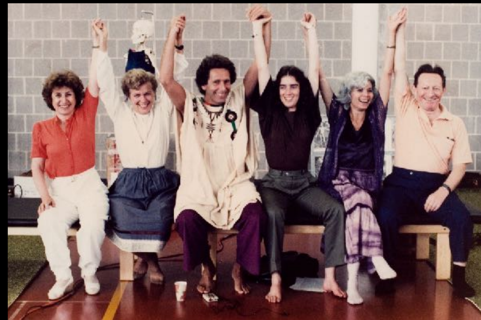
Les premiers assistants israéliens de Moshe Feldenkrais (formation professionnelle de Amherst)

3.4 B.- ENTRETIENS, DISCUSSIONS, PUBLICATIONS