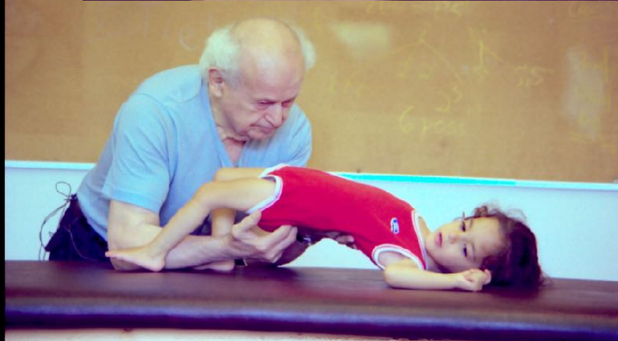
Moshe Feldenkrais donne des leçons d' Intégration Fonctionnelle MD à une enfant en difficulté (formation professionnelle de Amherst)

Courtoisie des archives de la Fédération Feldenkrais Internationale (IFF)